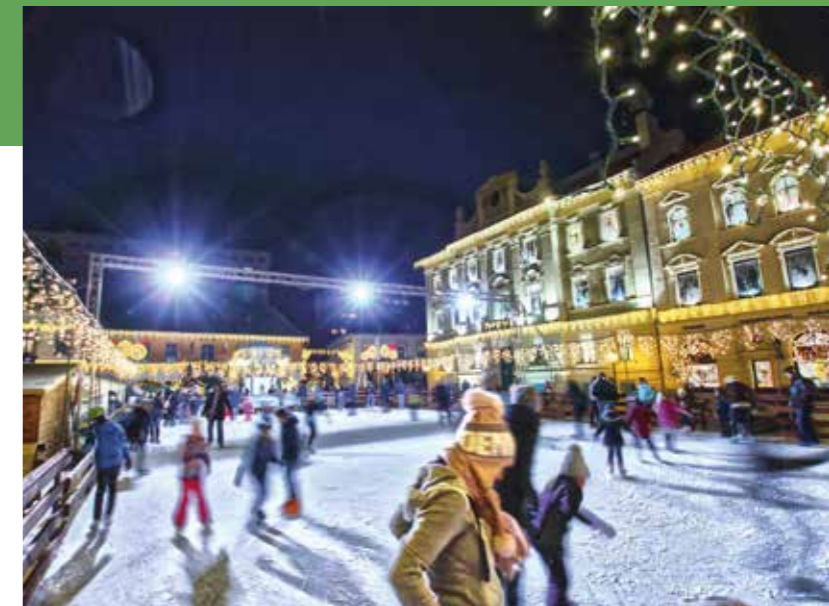
A Fő téren 2007 óta minden télen jégpálya várja a korcsolyázni vágyókat

Az Advent Óbudán rendezvény elmaradhatatlan kelléke volt minden évben a Fő téren, majd a Csobánka téren is felállított ingyenes jégpályák . A pályákon minden korcsolyázni szerető hódolhatott ennek a sportágnak, de a gyakorlatlanabbaknak korcsolyaoktatást is biztosítottunk. Hétközben az iskolák a mindennapos testnevelésórák keretében is igénybe vehették a pályákat. Átlagosan egy szezonban több mint 70 ezren látogatták a korcsolyapályákat.