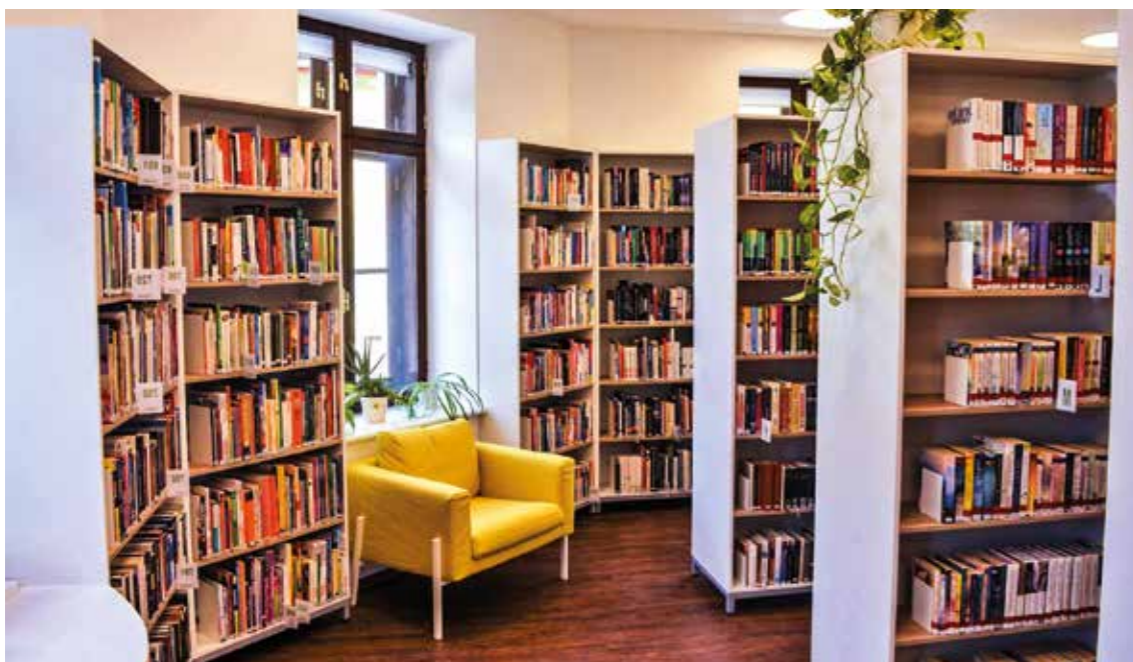
Ezüsthegy utcai könyvtár

Felújítottuk az egyedi belsőépítészeti megoldásokkal rendelkező, 1973-ban épült Óbudai Kulturális Központ épületét, az óbudai kulturális élet zászlóshajóját. Új padló-és falburkolat, kifestett terek, megújított toló-és harmonikafalak fogadják a közönséget.