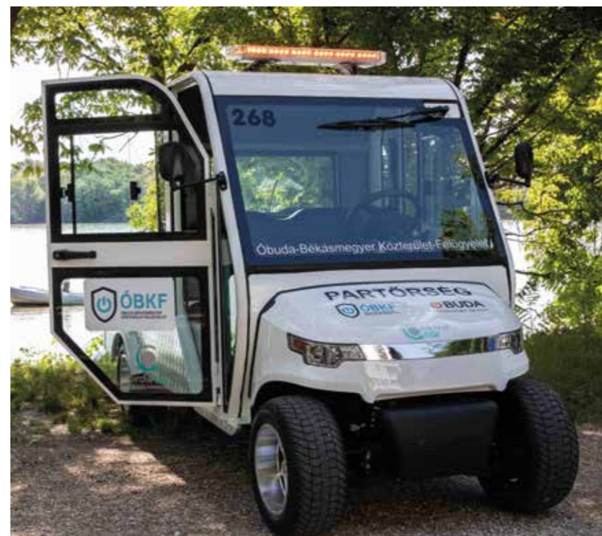
E-motoros járőrautó a Római-parton

Összesen 30 kerületi közintézményben, illetve Máltai játszótéren hoztunk létre Életmentő Pontot , ahol félautomata defibrillátor és az intézményben egy kijelölt elsősegély tanfolyamot végzett kolléga áll rendelkezésre baj esetén. A berendezések a használat hangesztésével segíti a szakszerű mentésben, különösen a hirtelen szívmegállás esetén lehet életmentő az alkalmazása. Ezen túl a kerületi rendőrség, a polgárőrség és a közterület-felügyelet egy-egy járőrautóját, illetve a tűzoltóság 3 járművét is felszereltük mobil életmentő berendezéssel .