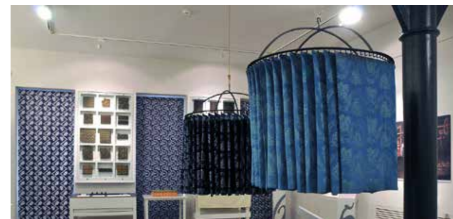
Goldberger Textilipari Gyűjtemény

Míg 2001-ben az akkori kulturális koncepció kidolgozásánál az összköltségvetésből a kultúrára fordítható összeget célként 1%-ra tűzték ki, 2019-re ez a keret a 8%-ot is meghaladta. Mindez végül azt eredményezte, hogy Óbudát, mint a kultúra városát emlegették, az itt élőknek pedig se nem kellett költenie a kultúrára, se nem kellett elhagyniuk a kerület határát a szellemi feltöltődésért. Kulturális koncepciónk alapvető célkitűzése volt, hogy mindenki számára hozzáférhetővé tegyük a kultúrát, azaz a kultúrafogyasztást ne akadályozza sem fizikai, sem anyagi tényező. Ennek érdekében színvonalas programokat vittünk „házhoz” és ingyenessé tettük azokat. A programokat szervező intézményrendszert is bővítettük és átalakítottuk. Az Óbudai Kulturális Központ gazdasági társasággá alakításával a kerületi kulturális élet fellendítése, a 4 közösségi ház és a Civil Ház működtetésével a kulturális koncepció megvalósítása volt a cél.