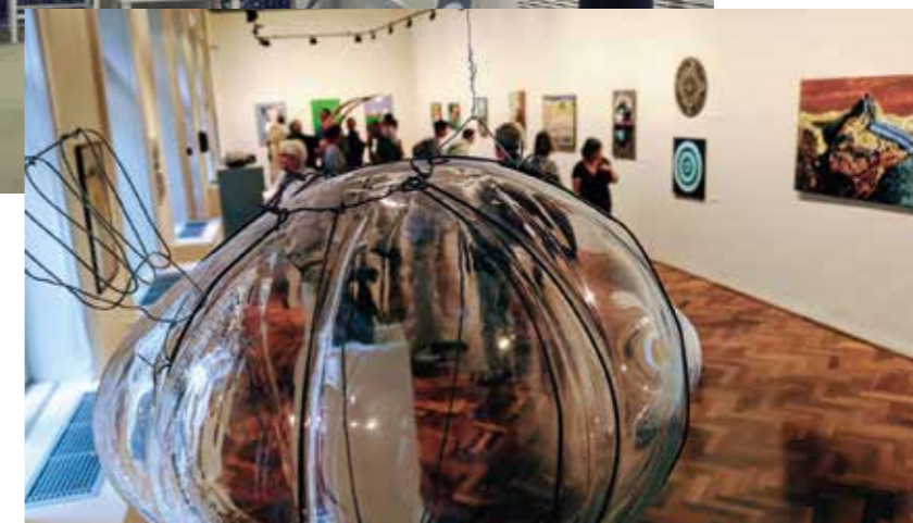
Kiállítás az Esernyős Galériában

A 3K-Kaszásdűlői Kulturális Központ létrehozásával Törökkő, Filatorigát és Kaszásdűlő területén élőknek tettük elérhetővé a közösségi és kulturális élmények helyben történő megélését. A volt MDF székház teljes belső átalakításával 150–200 ember befogadására vált alkalmassá.