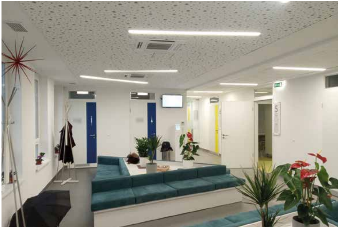
A felújított Csillaghegyi Egészségház

Létrehoztuk az egynapos sebészeti ellátást a Szent Margit Rendelőintézet falain belül. A páciens-központú, magas színvonalú szakmai ellátást azért szorgalmaztuk, hogy az egyszerűbb egészségügyi beavatkozások elvégzéséhez ne kelljen a betegeknek napokra kórházba vonulniuk.