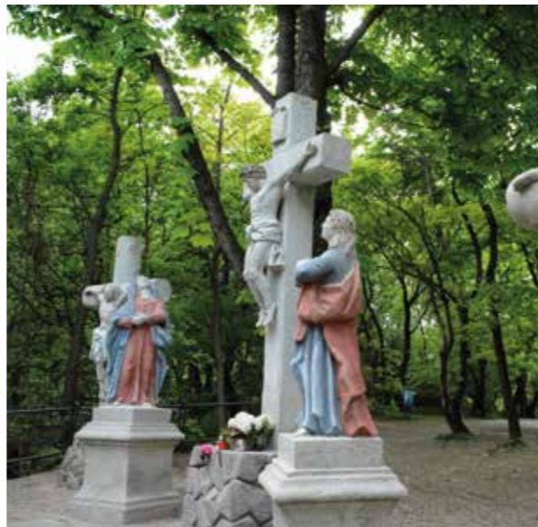
A felújított kiscelli kálvária keresztútjának egyik stációja