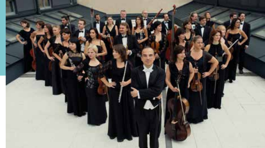
Óbudai Danubia Zenekar

ra mellett vagy részeként szintén nagyon fontos volt, hogy Óbuda felkerülhessen Budapest turisztikai térképére. Ennek első lépéseként létrehoztuk az Esernyős Kulturális, Turisztikai és Információs Pontot. A modernitás jellemezte ezt az intézményt mindamellel, hogy a turisztikai értékeink, programjaink összefogásával elérte, hogy a turisták már nemcsak átutaztak városrészünkön, hanem kifejezetten az itt kínált látnivalóért, élményekért érkeztek hozzánk.