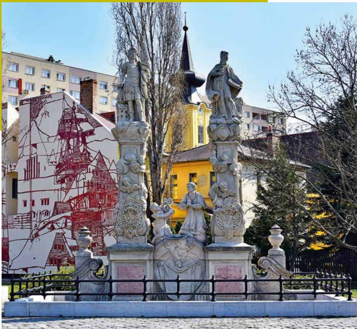
A felújított Szent Flórián-szobor és a háttérben a Kós Károly ihlette falfestmény az óbudai református parókia tűzfalán

Egy új kerületi komolyzenei centrum alapjait tettük le azzal, hogy bérbe adtuk az Óbudai Danubia Zenekar számára az egykori Flórián mozi épületét. Az épületben otthonra találtak és emellett, hogy kiváló próbaterem még előadásokra is alkalmassá vált az épület a teljes rekonstrukciója által. A zenekar önkormányzati fenntartásba vétele több száz ingyenes programot eredményezett, köztük az iskolásoknak szervezett rendszeres zenei és zentörténeti előadások, az idősek klubjaiban rendezett koncertsorozatok vagy éppen az Óbudai Nyár hagyományos nyitókonzertjét is ők adták.