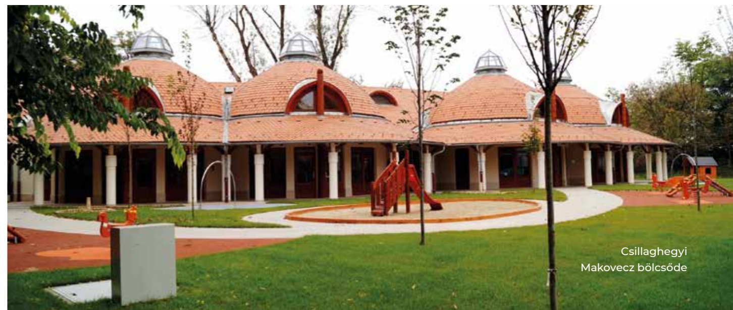
Csillaghegyi Makovecz bölcsőde

Elindítottuk az iskolákban az Iskolabüféprogramot , amellyel az iskolai büfék kínálatát tettük egészségesebbé. Már az első évben, 2008-ban, 19 iskola csatlakozott a programhoz, 2019-re szinte valamennyi iskola részt vett benne. A program évente versenyt hirdetett a büfék között, amely motiválta az üzemeltetőket az egészséges, sőt a kreatív ételek elkészítésében. A program minden évben a gyerekeknek meghirdetett vetélkedőkkel és előadásokkal tűzdelt egészségnappal zárult, ahol a csapatok felmutathatták az egészséges életmóddal kapcsolatos tudásukat.