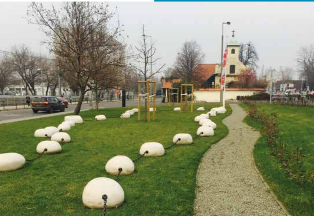
Boldog Jerzy Popieluszko emlékpark