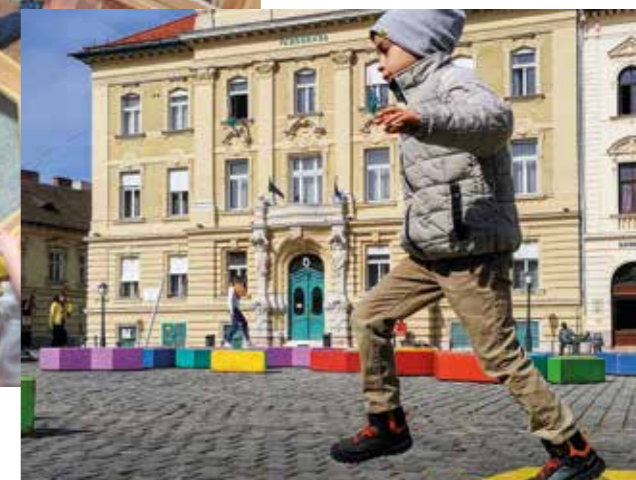
Játékos Fő tér

Biztosítottuk az iskolai szünidőkben a szociálisan rászoruló gyermekek ingyenes étkezését . 2012 óta évente gyarapodott kerületünk újabb és újabb KönyvMegállókkal . 2019-ben már 6 felnőtt és 5 gyermek szabadterei könyvesszekerénynek örvehdettek az olvasni szeretők. Nyáron a Római-partra mozgó könyvtárat vittünk, az ott működő Fellini Római Kultúrbisztró nyári filmvetítéseit pedig bekerültek az Óbudai Nyár programsorozatába. Mind a könyvsszekerényekkel, mind pedig a mozgó könyvtárral az olvasást kívántuk népszerűsíteni.