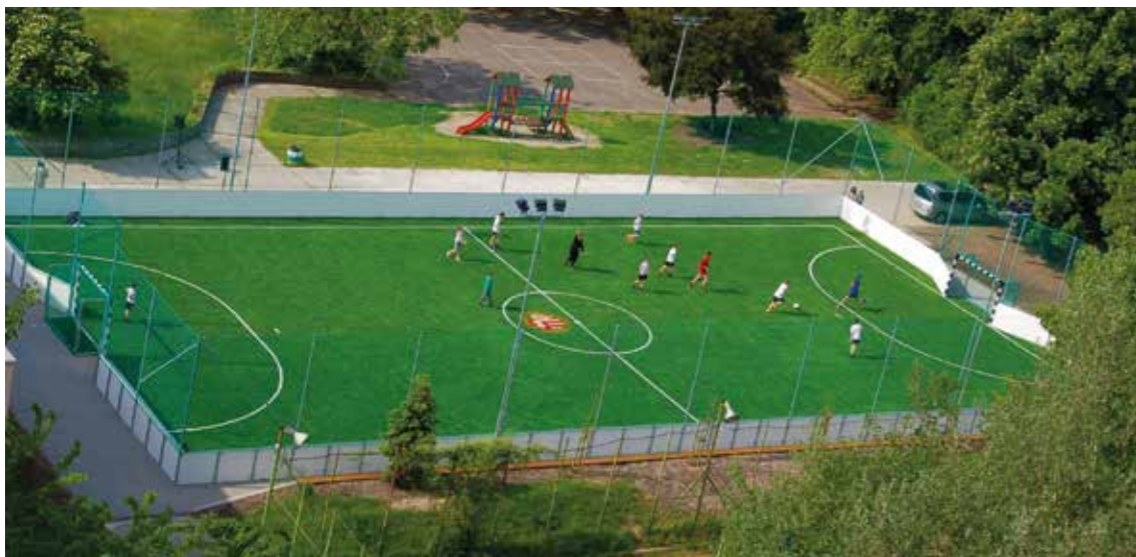
Műfüves pálya a Pais Dezső Általános Iskola udvarán

A sportfejlesztések nyomán pályázati támogatás segítségével 13 kerületi általános iskolába építettünk műfüves focipályát , ezen túl a Barátság szabadidőparkban is ilyen pályán játszhatnak mérkőzéseket a gyerekek és a felnőttek egyaránt.