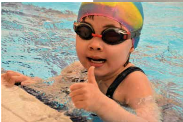
Ingyenes iskolai korcsolya- és óvodai úszásoktatás

Európa bajnokok, világbajnokok és olimpikonok, sportszakemberek előadásait hallgathattuk az Óbudai Sportakadémia előadásain. Benedek Tibor, Szilágyi Áron, Kovács Koko István olimpikonok is vendégei voltak a népszerű ingyenes előadássorozatnak, ahol a neves előadók személyes tapasztalataikat, tanácsaikat is megosztották az óbudaiakkal.