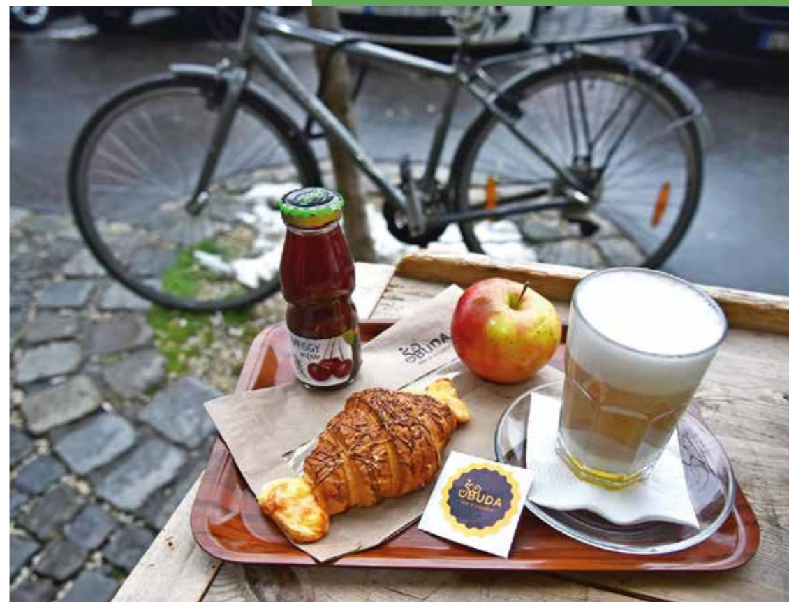
Bike & Breakfast bringásreggeli

a Bike & Breakfast-et. Az évente 9 hónapot felölelő programon több ezer bringás pattant nyeregbe, és reggelizett az akció keretében. Az ingyenes program célja az volt, hogy azokat is kerékpárra ültesse, akik egyébként a hétköznapiak során más közlekedési formát választanának. Az egészségmegőrző kezdeményezés rendkívül sikeres volt, köszönhetően az együttműködő vendéglátóhelyeknek is.