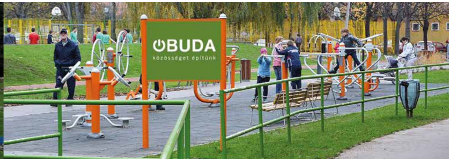
Szabadtéri fitnesspark a Laktanya utcában

2019 év végéig összesen 22 szabadtéri fitnessparkot telepítettünk. Ahol a közösségi tervezés alkalmával az ott élők street workout eszközöket is szerettek volna, oda azokat is kihelyeztünk. A parkok sportolási lehetőséget nyújtanak mindazoknak, akik nem szeretnek fitnessterembe járni, vagy nem engedhetik meg maguknak, hiszen a közterületekre kihelyezett eszközök ingyenesen használhatóak. Tájékoztató táblák a preventív és erősítő mozgásformákat is bemutatják a gyakorlatok helyes elvégzése érdekében, továbbá alkalmanként edző segítségével is elsajátíthatják a helyes használatot a park látogatói.