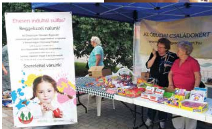
Rászoruló gyermekek reggeliztetése