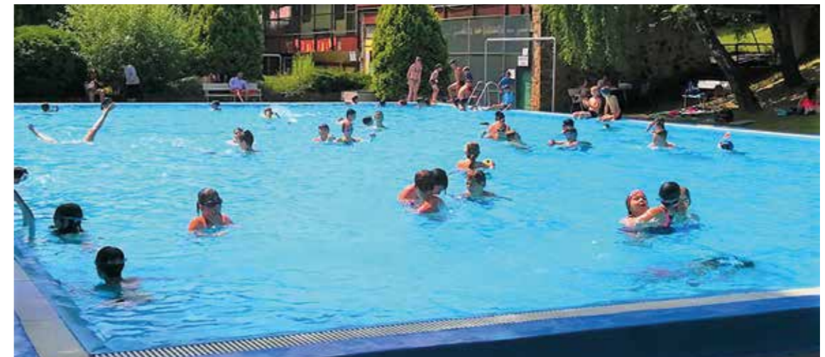
Napközis tábor a Barátság parkban

A kerületi napközis tábornak és az Óbudai Teniszakadémiának is helyet biztosító Barátság Szabadidőpark fejlesztése is fontos célkitűzése volt a kerület vezetésének. A medencék, a területen található kiszolgáló épületek felújítása, a teniszpályák fölé fűthető sátor telepítése, a parkoló és gyalogút murvával való feltöltése, egy strandröplabdapálya építése, majd később egy műfüves focipálya és egy szabadterei fitnesspark kialakítása is a korszerűsítés része volt.