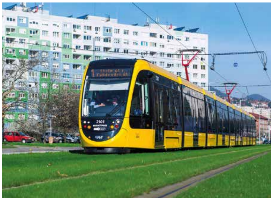
Az 1-es villamos fűvesített pályája

A TVE sportlétesítmény korszerűsítése TAO támogatással és önkormányzati önrésszel valósult meg 2016-ban. Több műfüves pálya, szabványosított labdarúgó nagypálya, rekortán atlétikai pálya, utánpótlásképző- és szabadidőközpont, 500 fős lelátó és egy 33 méteres medencés fedett vízilabdacsarnok épült a Hévízi úti telepre. Az Egyesülettel kötött megállapodás értelmében az uszodát a kerületi lakosok kedvezményesen használhatják.