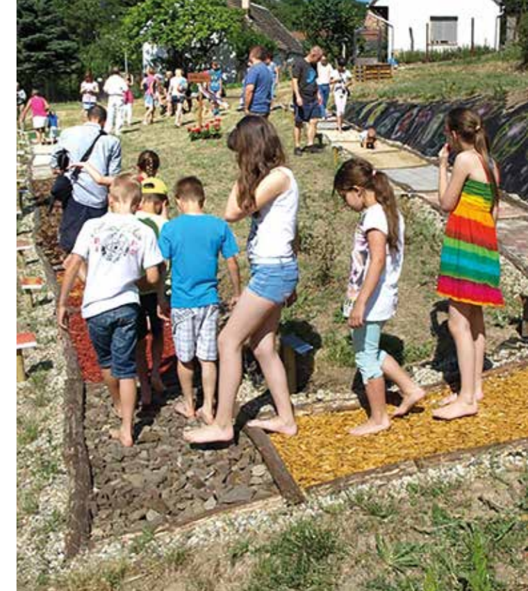
Mezítlábas park Békásmegyer-Ófaluban

Összesen közel 50 játszóteret kezelt Óbuda-Békásmegyer Önkormányzata. 2014-től nagyszabású játszóterrekonstrukciós programot indítottunk el, annak érdekében, hogy a kerület valamennyi játszótere megfeleljen az uniós biztonsági követelményeknek és megújult környezetben, új játékeszközökkel fogadhassák a gyermekeket. Tíznel is több új játszóteret építettünk, köztük az Árok utca – Kőbánya utca sarkán lévő, ami egy mezítlábas parkkal együtt készült el, de említhetnénk a csillaghegyi Makovecz bölcsőde melletti mini szabadidőparkot is. Ezen túl kerületünkben található a legtöbb (7 db) Máltai játszótér is, melyek üzemeltetését támogattuk . Ezek mindegyikén játszóház és mosdó is található, valamint félautomata defibrillátor készülékekkel is felszereltettük azokat. Külön öröm volt számunkra, hogy támogathattuk a Pünkösdfürdő utca – Hatvany Lajos utca sarkán található speciális játszótér eszközeinek beszerzését, amelyek esélyegyenlőséget biztosítanak a speciális igényű gyermekeknek is.