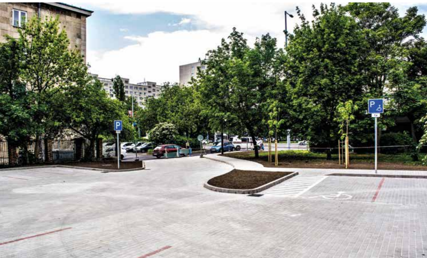
Parkolófejlesztés a kerületben

A biztonságos közlekedés érdekében több körforgalmat, új csomópontokat és gyalogátkelőhelyeket is építettünk. Így készült el a Remetehegyi út és a Kolostor utca kereszteződésében a körforgalmi csomópont, és Üröm településének támogatása nélkül az Ürömi út – Dózsa György út – Pusztakúti úti lámpás csomópont . Jóllehet nem kerületi önkormányzati feladat, de a lakossági kérésnek eleget téve zebrát építettünk a Nánási út – Vitorla utca csomópontban , 2 gyalogátkelőt a Búza – Zab utca találkozásánál és a folytatásában található felüljáró melletti úton, illetve a Pütkösdűfűdő utcán egy középszigettel ellátott átkelőhelyet is kialakítottunk. Elkészült a pütkösdűfűdői csomópont átépítése is. Az útpálya és járdafelújítás, a buszmegálló új burkolata és a megújult közvilágítás mellett 130 fát is ültettek.