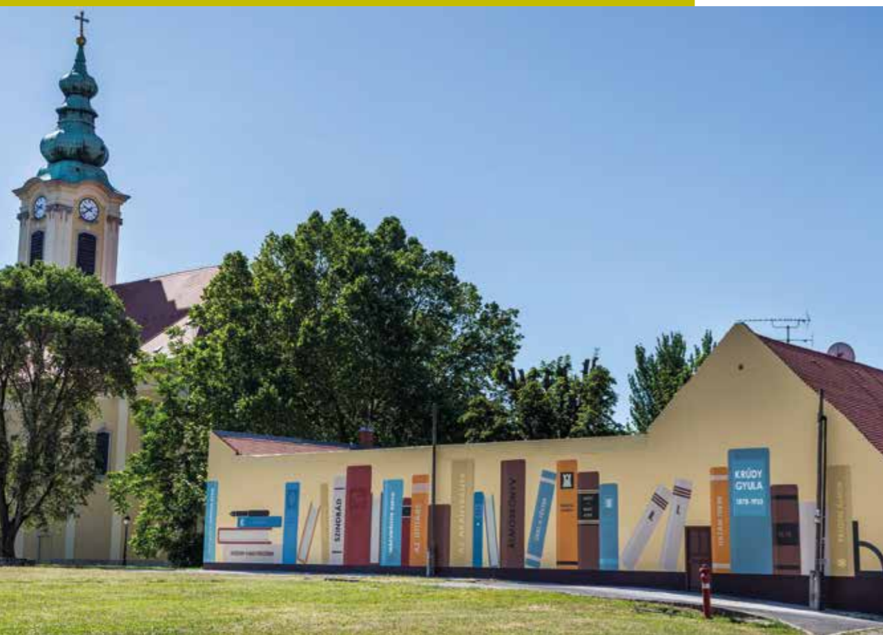
Falfestmény a Tanuló utcai katolikus plébánia melléképületének falán

Míg 2001-ben az akkori kulturális koncepció kidolgozásánál az összköltségvetésből a kultúrára fordítható összeget célként 1%-ra tűzték ki, 2019-re ez a keret a 8%-ot is meghaladta. Mindez végül azt eredményezte, hogy Óbudát, mint a kultúra városát emlegették, az itt élőknek pedig se nem kellett költenie a kultúrára, se nem kellett elhagyniuk a kerület határát a szellemi feltöltődésért. Kulturális koncepciónk alapvető célkitűzése volt, hogy mindenki számára hozzáférhetővé tegyük a kultúrát, azaz a kultúrafogyasztást ne akadályozza sem fizikai, sem anyagi tényező. Ennek érdekében színvonalas programokat vittünk „házhoz” és ingyenessé tettük azokat. A programokat szervező intézményrendszert is bővítettük és átalakítottuk. Az Óbudai Kulturális Központ gazdasági társasággá alakításával a kerületi kulturális élet fellendítése, a 4 közösségi ház és a Civil Ház működtetésével a kulturális koncepció megvalósítása volt a cél.