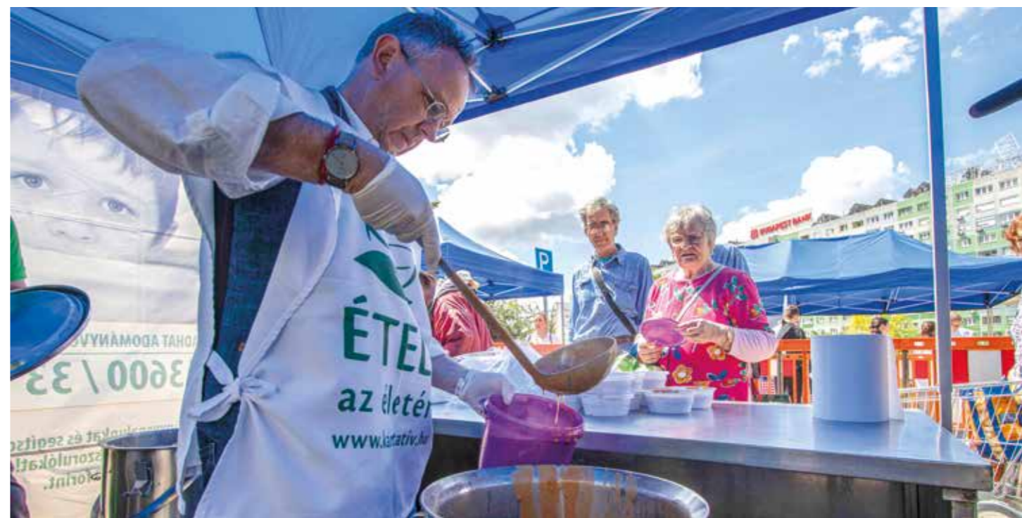
Gyermeknapra ételosztás a Krisna-tudatú Hívők Közösségével

Közel 200 civil szervezettel volt együttműködési megállapodásunk, amelyeket költségvetési soron, civil működési pályázat keretében és egyéb támogatási formákban támogattunk. Ezek mindegyike az egészségügyi, szociális, oktatási, sport, kulturális területen hiánypótló munkájával erősítette hálózatunk működtetését. Az Ételet az Életért Alapítvánnyal például több mint 10 éves múltra visszatekintő együttműködésünk keretében naponta 600 adag melegételt osztottunk a kerület 3 pontján a rászoruló családoknak, valamint évente kétszer nagyszabású, 800–800 adag melegételt és tartósélelmiszer-csomagozást rendeztünk az óbudai nehézsorsú családoknak. Óbuda élen járt az élelmiszerek mentésében is. 2012-ben kötöttünk együttműködési megállapodást a Magyar Élelmiszerbankkal, aminek köszönhetően az óbudai családok a Családsegítőn keresztül heti rendszerességgel jutottak húshoz, felvágotthoz, zöldségfélékhez, konzervekhez, édességhez, pékáruhoz. Az adományok több ezer felnőttnek és gyermeknek nyújtanak segítséget a mindennapokban.