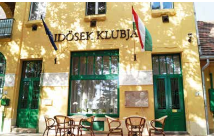
Almási Balogh Lóránd Idősek Klubja

A szociális területen végzett munkánkért , kiemelten az esélyegyenlőséget hatékonyan kezelő településpolitika folytatása és a fogyatékos emberek helyi szervezeteivel való szoros együttműködése okán elnyertük a Befogadó Magyar Település díjat , valamint oklevéllel és emléklakettel ismerte el az Emberi Erőforrások Minisztériuma a gyermekvédelem területén végzett kiemelt munkánkat .