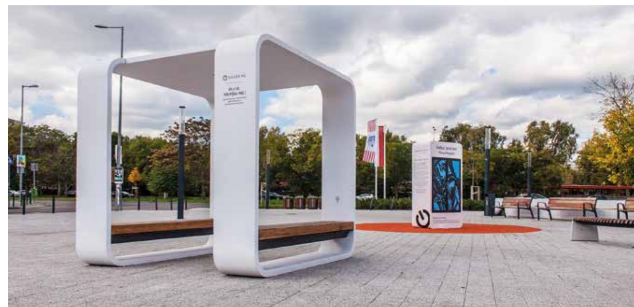
Okospad és Könyvmegálló a Heltai téren

Óbuda-Békásmegyer a fővárosi kerületek között is az egyik legkiterjedtebb zöldfelülettel rendelkezik. Évente átlagosan 300 fát ültettünk. Majd 2017-ben valamennyi környezetvédelmi és zöldtörekvésünket egy átfogó programba rendeztük, amely lehetővé tette, hogy az egyes akciók egymást erősítsék. A Guckler Károly Környezetvédelmi Program a fenntarthatóság jegyében fogalmazta meg célkitűzéseit. A fastratégiánk is komplexebb megoldásokat kínált. Elkészítettük alapként a kerületi fakatasztert, amely sorra vette a kerület teljes zöldállományát, valamennyi fát és a teljes cserjepopulációt, az üresen álló fahelyekkel együtt. Így született meg a közösségi faültetés ötlete, amely keretében 10 év alatt 10 ezer fa elültetését tűztük ki Óbudán . Ugyancsak ekkor kötöttünk együttműködési megállapodást a Szent István Egyetem tájépítész karával, hogy a Testvérhegy és a Táborhegy volt bányaterületeire alkossanak faültetési koncepciót, pontosabban erdőszítést. Ezek a területek 3000 fát ültettünk volna. A 13 év alatt mindentől függetlenül több ezer fával gazdagítottuk a kerületet, csak az utolsó öt évben 6500 fát ültettünk, és parkfejlesztésekkel jelentősen megnöveltük a zöldfelületek nagyságát .