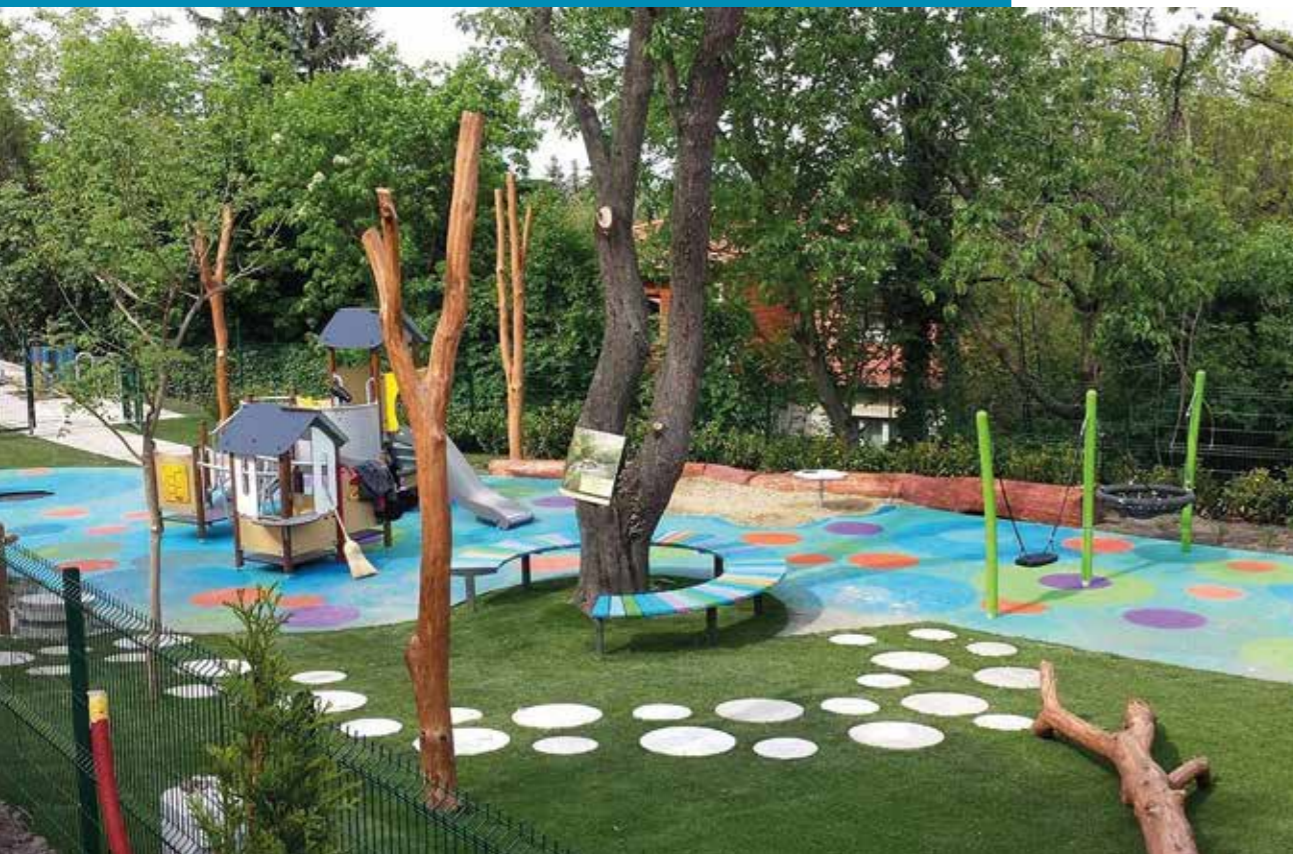
Ilonka utcai játszótér

A lakosság véleménye elengedhetetlen az élhető város megteremtésében. Ezért hívtuk életre a közösségi tervezés fórumát 2016-tól, amely során a szakemberek a lakossággal közösen tervezhették meg a közterületeket, s azok funkcióit. Ennek köszönhetően az így megvalósult terek, parkok az ott élők igényeit maximálisan tükrözik, sőt az így megújult vagy újonnan kialakított találkozási pontokat a kerületiek magukénak érezve, állapotát hosszútávon óvják és vigyáznak a tisztaságukra. A közterület megújításokhoz kapcsolódó közösségi tervezés közel 4 éve alatt, 33 projekt valósult meg.