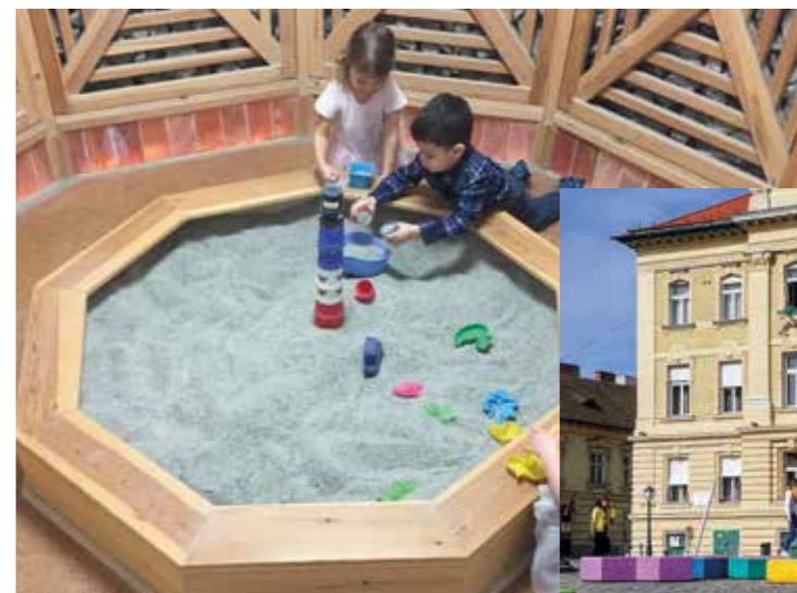
Sószoza a bölcsődében

A gyermekeket az első közösségi élmények a bölcsődékben érik éppen úgy, ahogy szervezetük is először találkozik idegen kórokozókka. A felsőlégúti megbetegedések ebben a korban nagyon gyakoriak, ezért több bölcsődében sószoza kialakításával igyekeztünk a kicsik egészségét megővni.