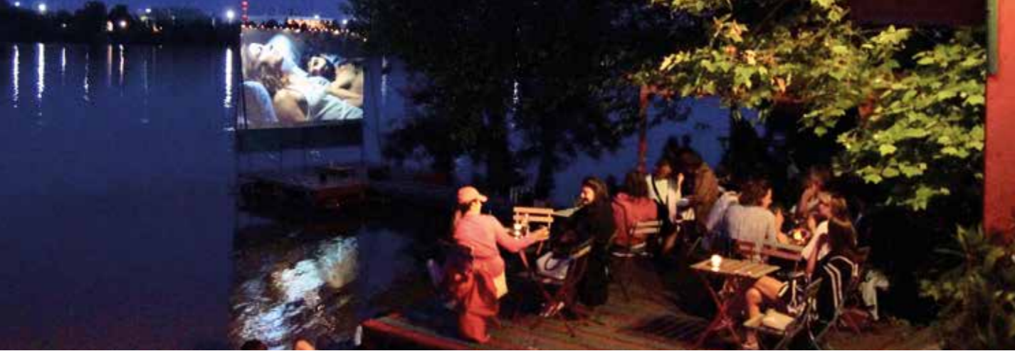
Filmvetítés a Fellini Római Kultúrbisztróban

Országosan is egyedülálló a kisgyermek zenei és beszédfejlődését elősegítő programot indítottunk a legkisebbeknek Élő népzene a bölcsődékben címmel. A program, amelynek lényege, hogy a népzene hallgatásával és közös énekléssel pozitívan befolyásolják a kisgyermek anyanyelvi fejlődését és a beszéd indulását, kivívták a legrangosabb szakmai elismeréseket, miniszteri oklevelet és Forrai Katalin Díjat kapott. A programot az óvodákra is kiterjesztettük az Óbudai Népzenei Iskola tanárai segítségével, itt már a hangszerekkel és a néptáncsal való ismerkedés is hangsúlyossá vált.