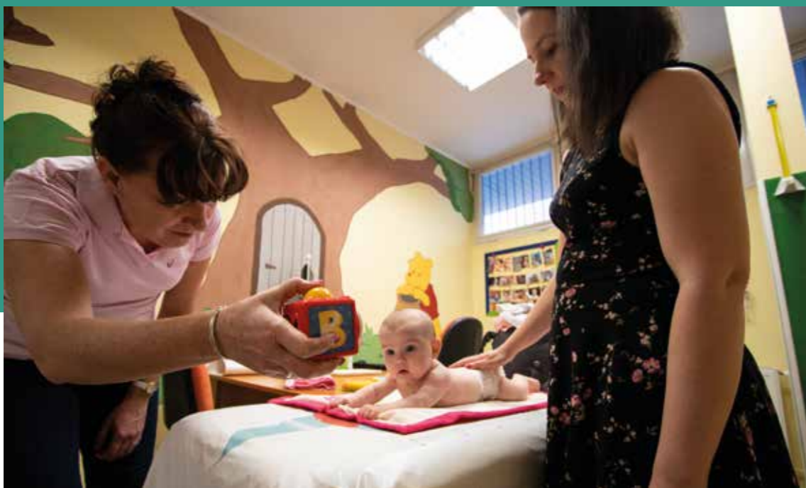
Felújított védőnői vizsgáló

Az infrastrukturális fejlesztések, az ingyenes kulturális- és sportprogramok, az átfogó játszótér-rehabilitációs programunk, a magas szakmai színvonalat képviselő óvodai és bölcsődei ellátás, a kerület zöldterületeinek nagy aránya évről évre több fiatal, ifjú házast vagy kisgyermekes családot csábított kerületünkbe. Ezért a 14 év alatt jelentősen megnöveltük az óvodai és bölcsődei férőhelyek számát , további több száz gyermeknek biztosítva a szolgáltatást. Ugyanezen oknál fogva 3 új védőnői körzetet is létrehoztunk.