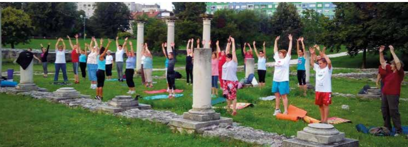
Közösségi Torna a Flórián téren

2016-ban elindítottuk a főként a távol-keleti országokban jellemző Közösségi Torna programunkat. Kezdetben elsősorban az idősekre koncentrálni nyújtó és lazító gyakorlatokkal, valamint chi kunggal várták a szakadók az érdeklődőket, majd a lakossági igényekre reagálva megjelent a kínálatban a gimnasztikus torna, a core training és egyéb dinamikusabb mozgásformák, amik már a fiatalabb korosztálynak is megfelelő aktivitást nyújtottak. Az ingyenes mozgásprogramot heti 5 napon keresztül a városrész 8 nagyobb terén élvezhették az egészséges életmód hívei.