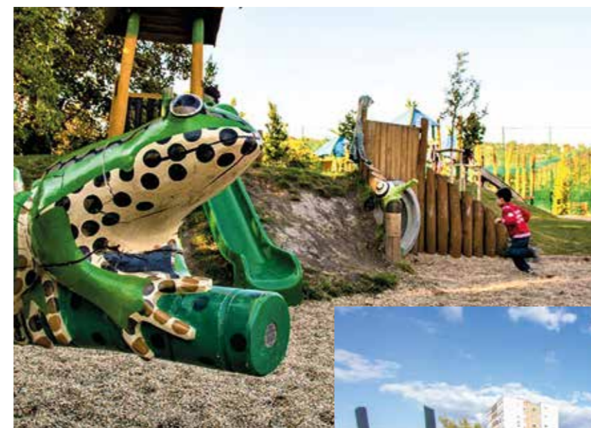
Tempлом utcai játszótér

a kikapcsolódást szolgálják. A Gladiátor utcai játszótér ugyancsak multifunkciós, hiszen a játszótér mellett közvetlenül egy szabadtéri fitnesspark is helyet kapott a sportos szülők kedvéért. A Mészköpark lakóközössége határozott elképzelésekkel fordult a városvezetéshez. Terveikben valamennyi korosztályra és egy kutyafuttató kialakításával a kutyákra is gondoltak. Az itt élőknek különösen fontos volt a növények diverzitása, ezért több száz cserje és facemete elültetésével gazdagítottuk a területet, valamint mézelő Evodia fák ültetésével, illetve egy közel 100 gyógy-és fűszernövényből álló ágyással a terület első és valódi méhlegelőjét is kialakítottuk az Országos Méhészeti Egyesület szakmai útmutatásával. A Holdudvar Park tervezését 2015-ben kezdtük meg a lakótelepi környezetben élőkkel. A széles körű összefogásnak köszönhetően több, mint 200-an alakították a közvetlen környezetüket. A multifunkciós park 40 év