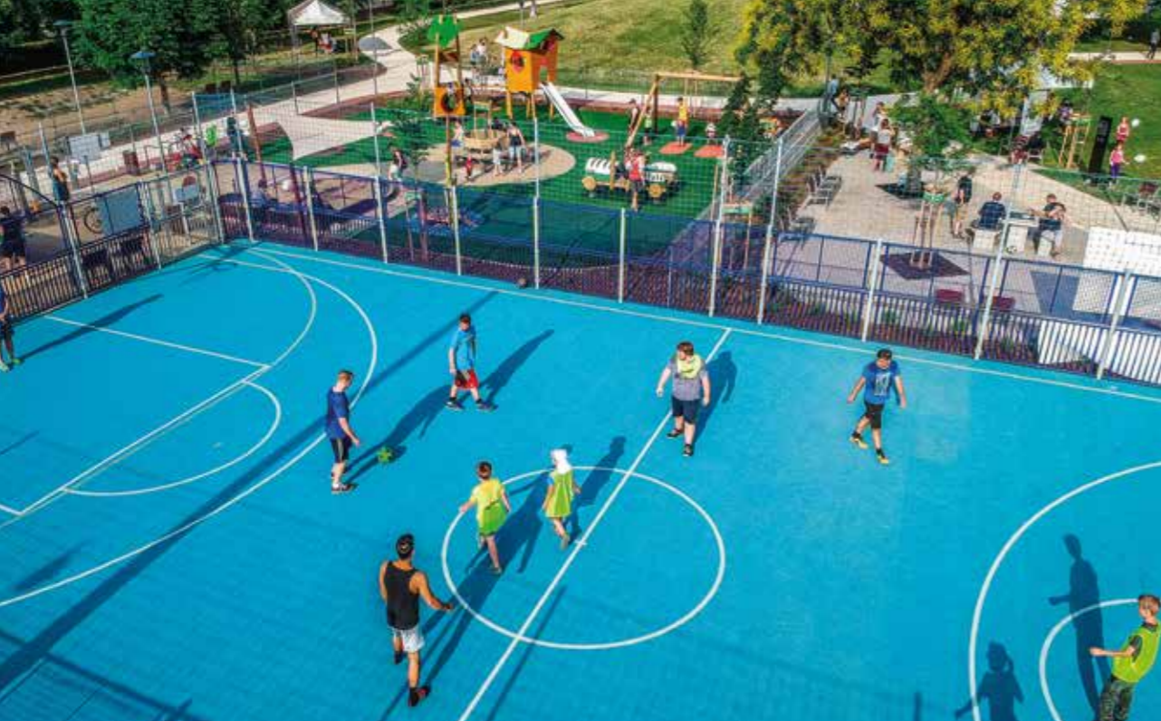
Boldog Sándor István park

után újra a közösségek találkozási pontja lett, ahol rekortán futókör, kutyafuttató, kisgyermekes játszótér, kamaszpark és fitneszeszközök is a kikapcsolódást szolgálják. A Boldog Sándor István park vagy, ahogy a környékeliek nevezik, a Derű utcai park mintegy 6000 m 2 -en újult meg. Különlegessége, hogy a park központi dombja, ami télen szánkódombként funkcionál, megmaradt a lakók kérésére. A régi funkció mellett megjelentek az új igények is, mint pl. a kosárlabdapálya, a futókör és a kutyafuttató. Belső Óbudán két olyan terület is funkciót kapott, amelyet hosszú éveken keresztül csak átjáróként használtak az arra közlekedők. A Szent Margit Rendelőintézet mellett így született meg az igény a kerületekben egy játszóteres parkra . A Szépvölgyi park ötletét pedig a zöldfelület hiánya szülte elsősorban. A kerület egyik legkaotikusabb közlekedési csomópontjában a park kialakításával a levegő minőségének és a városképnek a javítása is cél volt mindamellett, hogy az ott élők további parkolók kialakítását is kérték. A Lékai bíboros tér megépítése, ezen belül az 1848-49-es emlékpark Czetz János dandártábornok szobrával Óbuda emlékezet-politikájának fontos helyszíne lett . Az ott élők a parknak elsősorban pihenőfunkciót szántak, így padokat és sakkasztalokat álmodtak meg a területre 1500 évelővel és 400 cserjével. Utóbbi két parkfejlesztés a kormányval való jó kapcsolatnak köszönhetően jelentős támogatást élvezett.