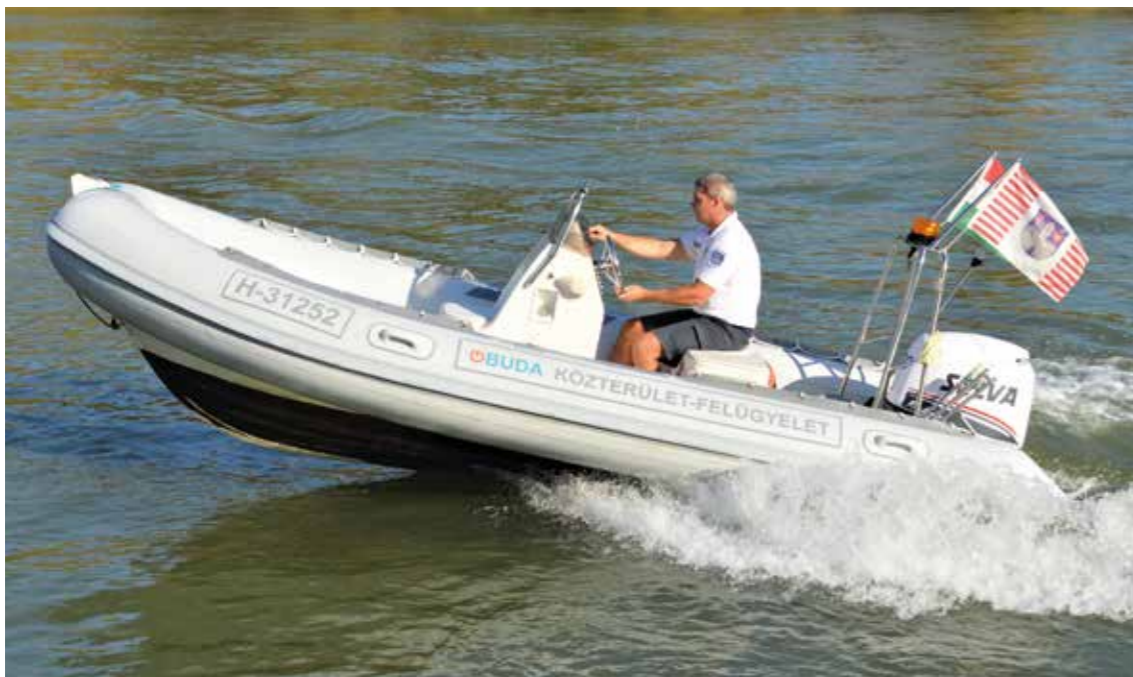
Vízi járőrszolgálat a Dunán

Kerületünk természeti adottsága és különlegessége a Duna közelsége. A Duna Római-parti szakaszán 3 nagyobb árhullám hagyott nyomot az ott élőkben, 2002-ben, 2009-ben és 2013-ban. Az árvízi védekezéshez minden segítséget megadtunk, összesen több százezer homokzsákot helyeztünk ki és osztottunk szét a lakosságnak, részt vettünk és támogattuk a fertőtlenítést, és a lakosság anyagi kárának megtérítését is. Az átmenetileg fedél nélkül maradtaknak a szabadon álló önkormányzati lakásokban és a nyugdíjasházakban biztosítottunk elhelyezést .