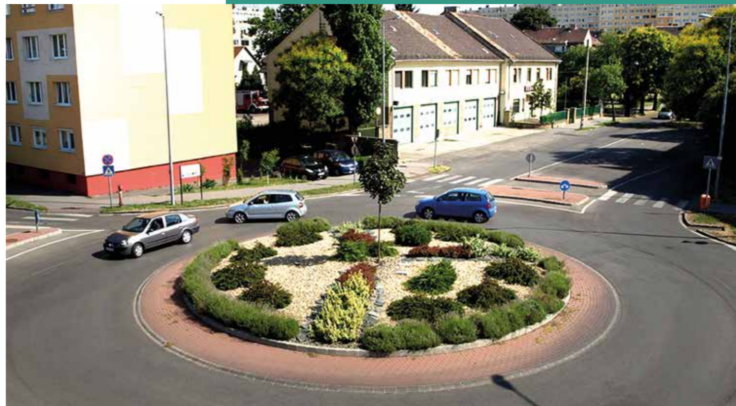
Váradi utcai körforgalom

Az utak és az úthálózat karbantartása, új utak építése, mint minden más kerületi önkormányzatot, Óbuda-Békásmegyert is kihívások elé állította. Az elérhető város feltétele a zökkenőmentes és biztonságos közlekedés feltételeinek megteremtése. Általánosságban elmondható, hogy évente közel 20 ezer m 2 út rekonstrukcióját végezte el az önkormányzat, amely tartalmazta az új utak megépítését, a teljes szőnyegezéssel helyreállított útszakaszokat, valamint a kátyúzással javított felületeket is.