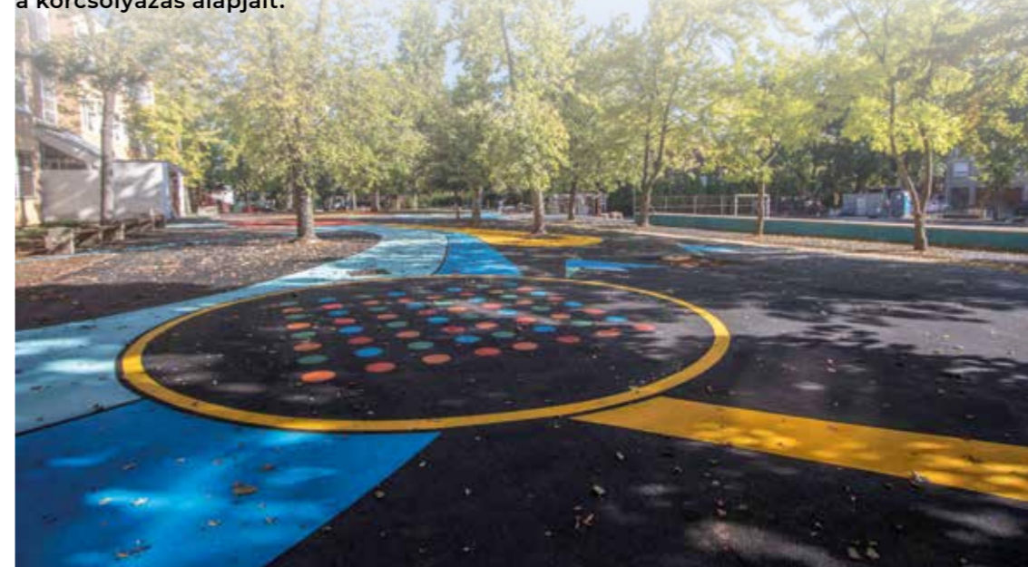
Aquincumi Általános Iskola udvarfejlesztése

Önkormányzatunk az egészséges életmódra nevelést segítette elő azzal, hogy ingyenes óvodai úszás és korcsolyaoktatást biztosított a kisgyermekeknek. Az óvodások úszásoktatásával a cél a vízhez szoktatás és a vízbiztonság megszerzése. Az óvodásokat külön buszokkal szállítottuk az uszodákba csakúgy, mint az iskolásokat a Gepárdok Jégcsarnokba, ahol az Óbudai Hockey Club edzői együttműködési megállapodásunk keretében vállalták az alsósok, 2018-tól pedig már a nagycsoportos óvodások korcsolyaoktatását. A 2015-től zajló programon évente 11 héten keresztül több száz gyermek sajátíthatta el az úszás és a korcsolyázás alapjait.