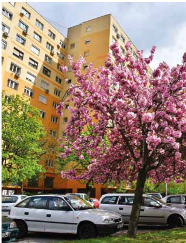
Megújított óbudai panel