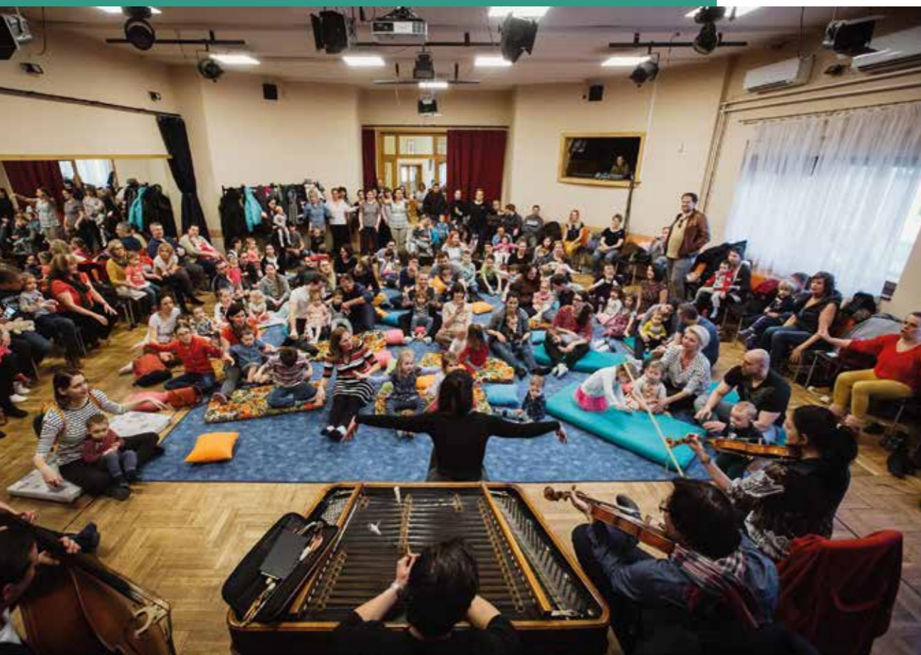
Élő népzene a bölcsődékben

Összesen közel 50 játszóteret kezelt Óbuda-Békásmegyer Önkormányzata. 2014-től nagyszabású játszóterrekonstrukciós programot indítottunk el, annak érdekében, hogy a kerület valamennyi játszótere megfeleljen az uniós biztonsági követelményeknek és megújult környezetben, új játékeszközökkel fogadhassák a gyermekeket. Tíznel is több új játszóteret építettünk, köztük az Árok utca – Kőbánya utca sarkán lévő, ami egy mezítlábas parkkal együtt készült el, de említhetnénk a csillaghegyi Makovecz bölcsőde melletti mini szabadidőparkot is. Ezen túl kerületünkben található a legtöbb (7 db) Máltai játszótér is, melyek üzemeltetését támogattuk . Ezek mindegyikén játszóház és mosdó is található, valamint félautomata defibrillátor készülékekkel is felszereltettük azokat. Külön öröm volt számunkra, hogy támogathattuk a Pünkösdfürdő utca – Hatvany Lajos utca sarkán található speciális játszótér eszközeinek beszerzését, amelyek esélyegyenlőséget biztosítanak a speciális igényű gyermekeknek is.