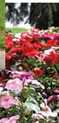
Virágosítás a közterületeken

2013-tól évente muskátliakciót szerveztünk, ahol a kerületiek kedvezményesen vásárolhattak a virágokból. Ezzel nemcsak a szociálisan rászoruló embereknek segítettünk, hanem Óbudát is virágba borítottuk. A szintén évente kiírt pályázataink, a Virágos Óbuda és a Fogadj Örökbe egy zöldterületet pályázat is ezt a célt szolgálták, csakúgy mint a virágtartók kihelyezése a városrész egy-egy forgalmasabb tereire és a lámpaoszlopaira.