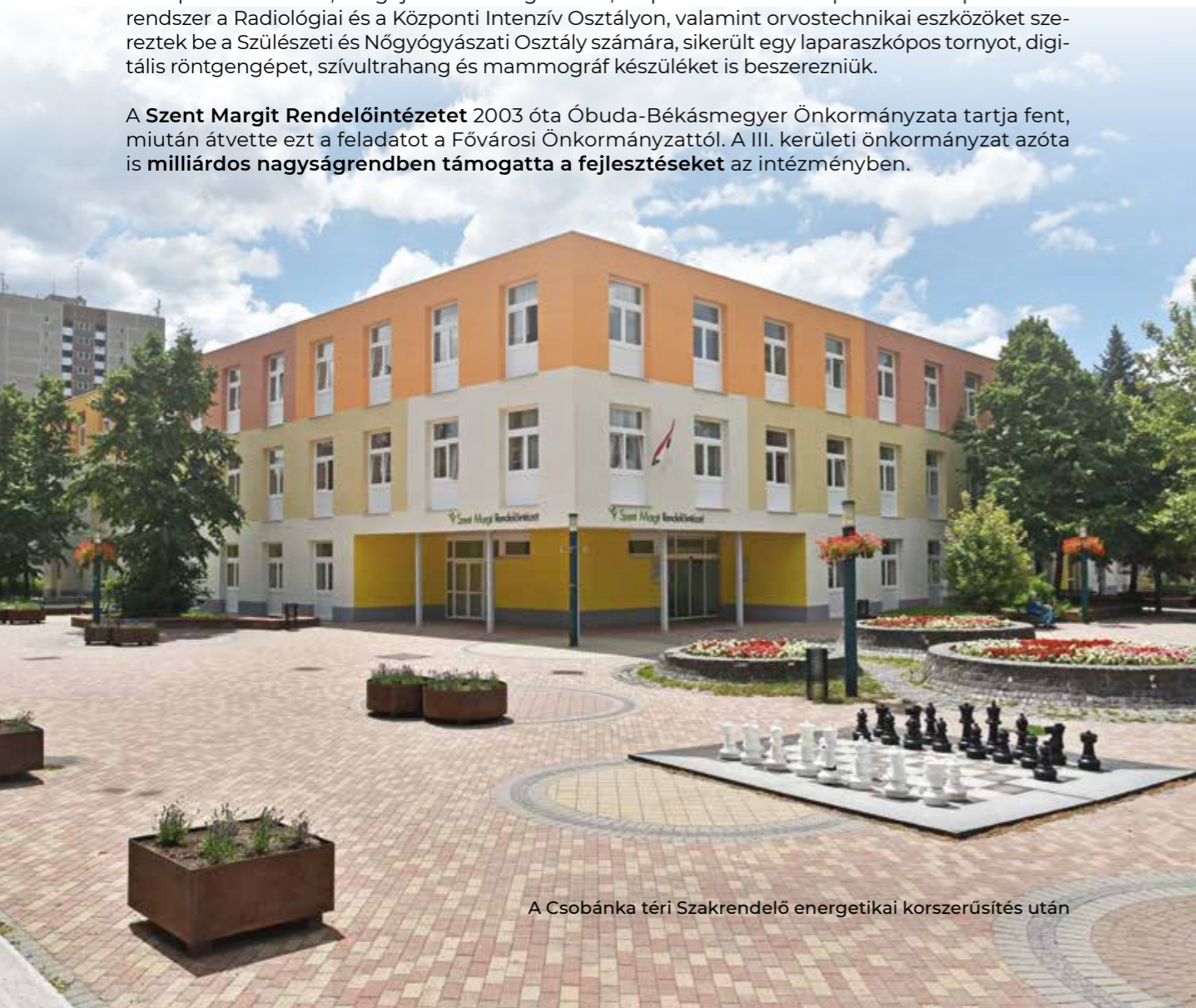
A Csobánka téri Szakrendelő energetikai korszerűsítés után

A Szent Margit Rendelőintézetet 2003 óta Óbuda-Békásmegyer Önkormányzata tartja fent, miután átvette ezt a feladatot a Fővárosi Önkormányzattól. A III. kerületi önkormányzat azóta is milliárdos nagyságrendben támogatta a fejlesztéseket az intézményben.