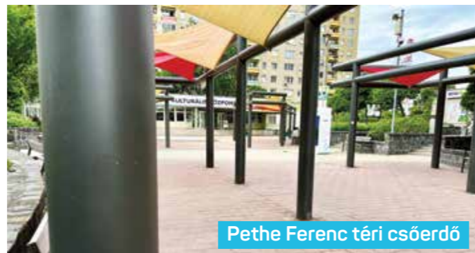
Pethe Ferenc téri csőerdő

Az említett 3 utca által határolt zöldterület munkálatait is a polgári vezetés közösségi tervezése előzte meg, amelyen kiderült, többnyire sportolásra, kutyasétáltatásra használták a területet. Voltak azonban egyéb kívánságok, ötletek is, ami miatt szükségessé vált egy olyan koncepcióba foglalni beavatkozás, amely kielégí-