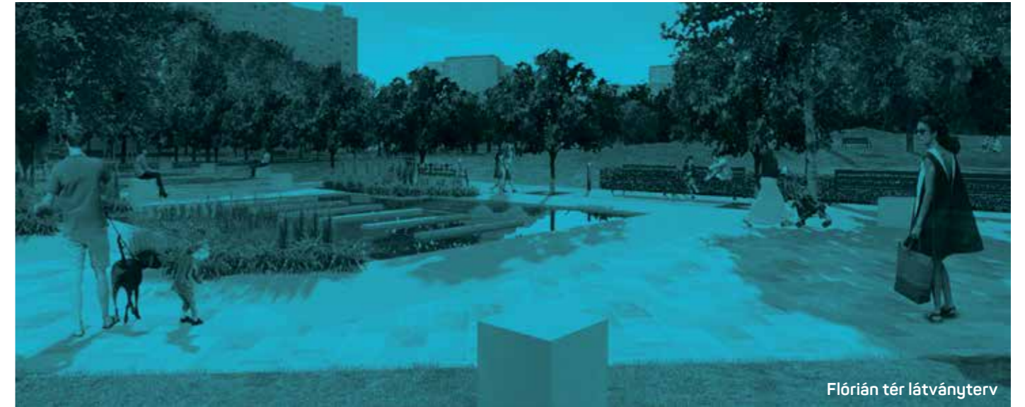
Flórián tér látványterv